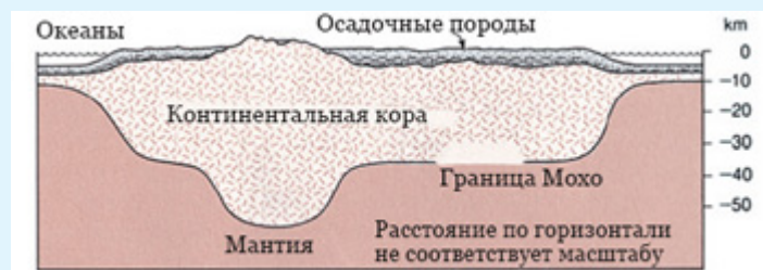
Рис. 1: Горы имеют глубокие “корни”, скрытые под земной поверхностью ( Earth [“Земля”], Пресс (Press) и Сивер (Siever), стр.(413.)