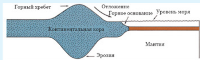
Рис. 3: Еще один рисунок, иллюстрирующий сходство горы с опорой из-за наличия у нее подземной части. (Earth Science , [“Наука о Земле”], Тарбук (Tarbuck) и Лутгенс (Lutgens), стр. 158.)

А вот как Коран описывает горы. Бог так говорит об этом в Коране: