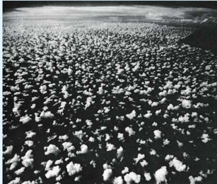
Рис. 2: Небольшие фрагменты облаков (кучевые облака) движутся к зоне конвергенции у линии горизонта, где мы можем видеть большое кучево-дождевое облако. (Clouds and Storms [“Облака и бури”],