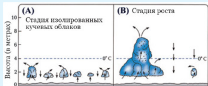
Рис. 2: (А) Небольшие разрозненные фрагменты облаков (кучевые облака). (В) Когда небольшие облака объединяются, восходящие потоки воздуха внутри этого большого облака становятся более сильными, в результате чего облако начинает расти в высоту. Капли воды показаны в виде значков (·). ( The Atmosphere [“Атмосфера”],Энтс (Anthes) и др., стр. 269.)