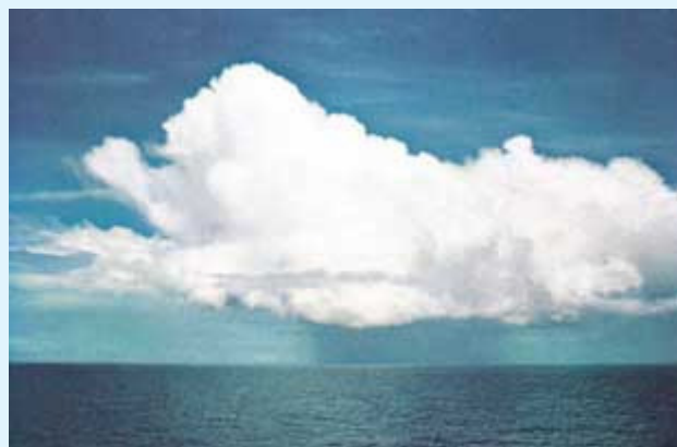
Рис. 4: Кучево-дождевое облако. ( A Colour Guide to Clouds [“Цветной атлас облаков”], Скорер (Scorer) и Уэкслер (Wexler), стр. 23.)