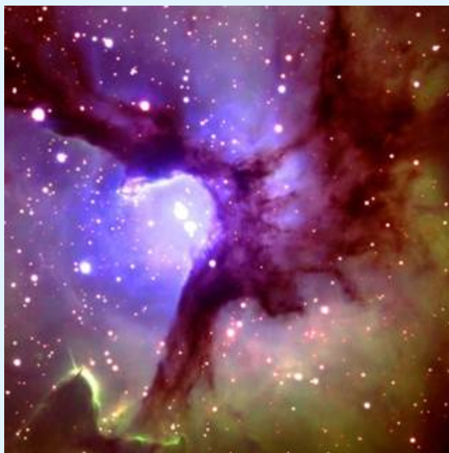
Рис. 2 Центральная часть Трёхнадрезной Туманности, снятой при помощи Телескопа Блинецов на Мауна-Кеа на Большом Острове Гавайи 5 июня 2002 года. Расположенная в созвездии Стрельца, красивая туманность – часто фотографируемое динамическое облако газа и пыли, где рождаются звёзды. Одна из массивных звезд в центре туманности была рождена приблизительно 100 000 лет назад. Расстояние от этой туманности до Солнечной Системы приблизительно от 2 200 до 9 000 световых лет.

сказал: «Естественные законы Вселенной настолько точны, что мы не имеем никакой трудности, строя космический корабль для полёта на Луну, рассчитать время полета с точностью до секунды. Эти законы, судя по всему, должно быть установлены кем-то». Пол Дэвис, профессор физики, заключает, что существование человека – не просто причуда судьбы. Он пишет: «Мы действительно предназначены, чтобы жить здесь». А о Вселенной он говорит: «Посредством моей научной работы я всё больше начинаю верить, что материальная Вселенная установлена настолько удивительно, что я не могу принять это просто как грубый случайный факт. Для всего этого, как мне кажется, должно быть более серьезное объяснение». Вселенная, земля, живые существа на земле являются молчаливыми доказательствами существования великого и мудрого Создателя нашей жизни.