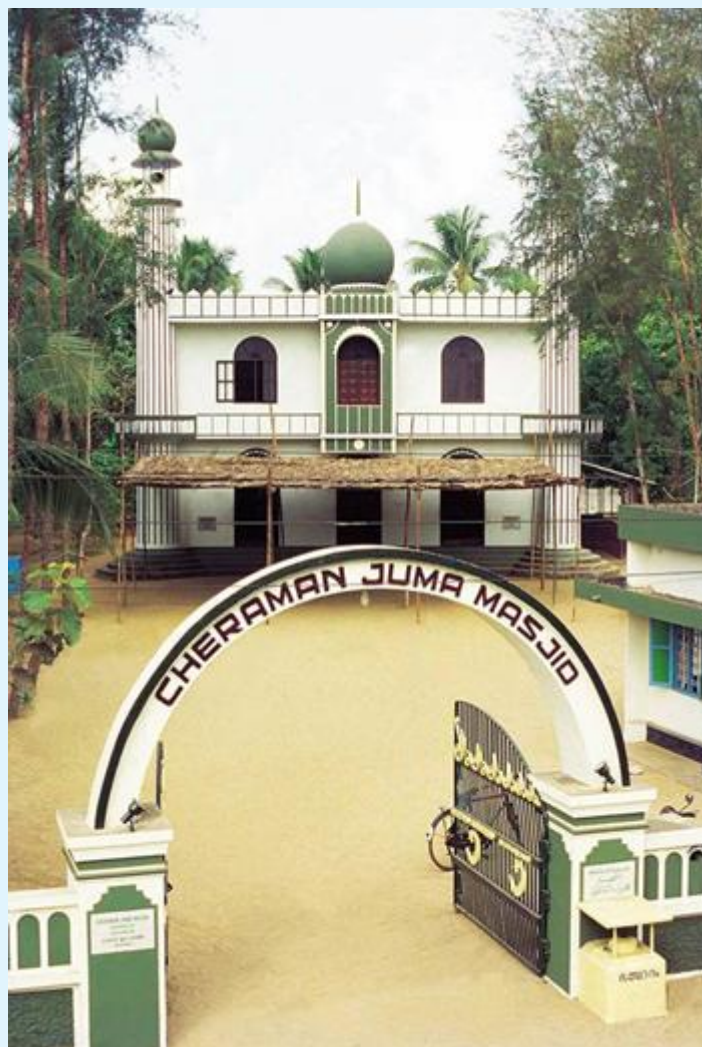
Чераман Джум'а масджид после реконструкции.

Встреча Мухаммада, да благословит его Аллах и приветствует, и короля Индии описана также в мусульманских источниках. Известный исламский историк Ибн Касир упоминает, что расколотую луну наблюдали в нескольких местах Индии. В хадисах также говорится о прибытии короля Индии и его встрече с пророком. Абу Саид Аль-Худри, сподвижник пророка, рассказывает: