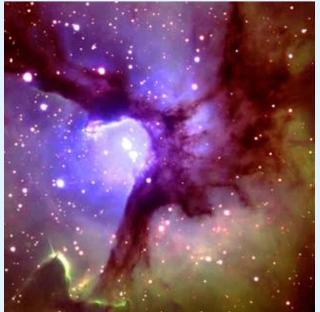
Figura 1 Região central da Nebulosa Trífide vista pelo Telescópio Gemini em Mauna Kea na Grande Ilha do Haváí, 5 de Junho, 2002. Localizada na constelação de Sagitário, a bela nebulosa é uma nuvem de gás e poeira onde nascem estrelas. Uma das estrelas massivas no centro da nebulosa nasceram aproximadamente 100.000 anos atrás. A distância entre a nebulosa e o Sistema Solar é considerada em torno de 2.200 a 9.000 anos luz.

Se fomos feitos por um Criador, então certamente o Criador deve ter tido uma razão, um propósito, em criar-nos. Portanto, é importante que busquemos saber o propósito de Deus para nossa existência. Após encontrarmos esse propósito, podemos escolher se queremos viver em harmonia com ele. Mas é possível sabermos o que é esperado de nós a partir de nossas próprias conclusões sem qualquer comunicação do Criador? É natural que o próprio Deus nos informasse desse propósito, especialmente se é esperado que o cumpramos.