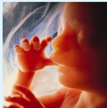
図1：命の驚異。親指を吸う誕生前の胎児。

「全ての子供はフィトゥラ の状態で生まれる。しかしその両親が、彼 彼女をユダヤ教徒やキリスト教徒にするのである。それはちょうど、家畜が正常な子供を出産するようなものである。あなた方は、あなた方がそれらの体の一部を損傷する前に、それらが損傷された形で生まれてくるのを見たことがあるか？」 [1]