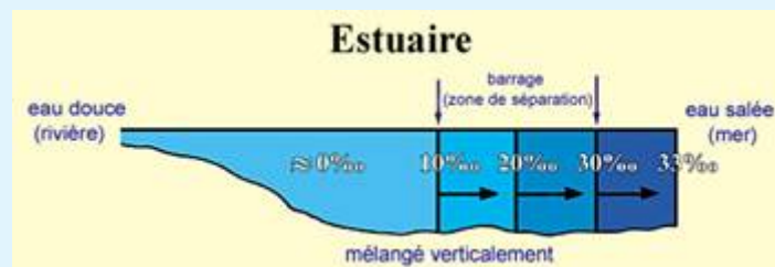
Illustration 2: Coupe longitudinale montrant la salinité (parties par millièème ‰) dans un estuaire. Nous pouvons voir le barrage (ou zone de séparation) entre l'eau douce et l'eau salée. ( Introductory Oceanography [Introduction à l'océanographie], Thurman, p. 301, avec une légère amélioration.)

La science moderne a découvert que dans les estuaires, où l'eau douce et l'eau salée se rencontrent, le phénomène est en quelque sorte différent de celui que l'on retrouve dans les endroits où deux mers se rencontrent. Il a été découvert que ce qui distingue l'eau douce de l'eau salée dans les estuaires est une "zone de pycnocline avec une discontinuité marquée au niveau de la densité, qui sépare les deux couches." [3] Ce barrage (ou zone de séparation) a une salinité différente de celle de l'eau douce et de celle de l'eau salée [4] (voir illustration 2).