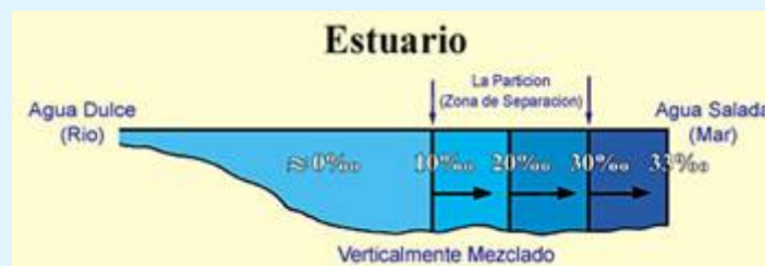
Figura 2: Corte longitudinal que muestra la salinidad (partes por mil 0/00), en un estuario. Aquí podemos observar la partición (Zona de separación), entre el agua dulce y la salada. (Levemente modificado de Introductory Oceanography [Oceanografía Introductoria], Thurman, p. 301.) (Haga click en la imagen para agrandarla.)

La ciencia moderna ha descubierto que en los estuarios, donde el agua dulce y la salada se encuentran, la situación es en cierta manera diferente a la que se encuentra en los lugares en los que dos mares se encuentran. Se ha descubierto que lo que distingue al agua dulce de la salada en los estuarios (o Deltas de un río) es una "zona pinoclina que posee una marcada discontinuidad en su densidad, que separa las dos capas." [3] Esta partición o división (zona de separación), tiene una salinidad diferente a la del agua dulce y a la de la salada. [4] (ver figura 2).