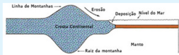
Figura 3: Outra ilustração mostra como as montanhas têm forma de estacas, devido às suas raízes profundas. (Ciência da Terra, Tarbuck e Lutgens, p. 158.)

solo. (Anatomia da Terra, Cailleux, p. 220.)