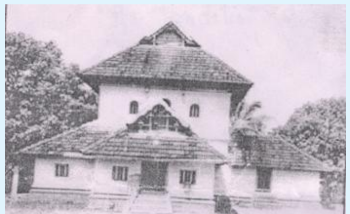
Photo de la Cheraman Juma Masjid, la plus vieille mosquée de l'Inde datant de l'an 629 de notre ère. Cette photo a été prise avant que la mosquée ne soit entièrement rénovée

On rapporte que le contingent du roi était mené par un musulman, Malik bin Dinar, et qu'il continua son chemin jusqu'à Kodungallure, la capitale des Chera, où il construisit la première mosquée de l'Inde, vers l'an 629 de notre ère, laquelle mosquée existe toujours aujourd'hui.