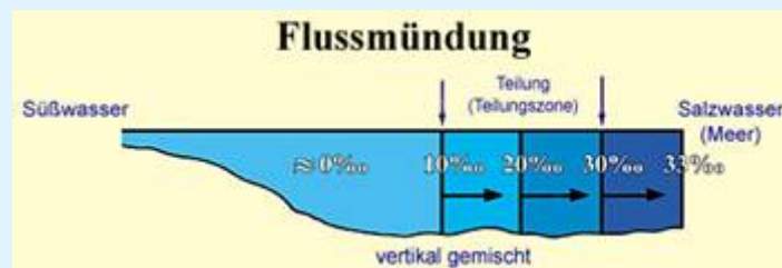
Abbildung 2: Längsschnitt, der den Salzgehalt (Parts per million [‰]) an einer Mündung zeigt. Wir können hier die Aufteilung zwischen frischem und salzigem Wasser sehen (Separationszone). ( Oceanography [Ozeanographie], Thurman, S.301, mit einer leichten Verbesserung.)

Moderne Wissenschaften haben herausgefunden, dass in Mündungen, wo frisches und salziges Wasser zusammentreffen, die Situation anders ist als an Orten, wo sich zwei Meere treffen. Es wurde entdeckt, dass das, was das frische Wasser von dem salzigen in den Mündungen unterscheidet, eine "pycnocline Zone mit einer erkennbaren Dichte ist, die zusammenhanglos die zwei Lagen trennt" [3] Diese Scheidewand (Trennungszone) hat einen vom frischen und vom salzigen Wasser unterschiedlichen Salzgehalt [4] (siehe Abbildung 2).